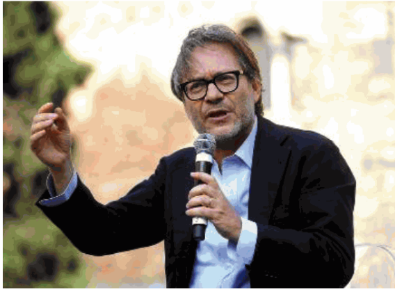
Massimo Recalcati, ideatore della kermesse

Si alza oggi il sipario su KUM! Festival, la kermesse creata e diretta dallo psicoanalista Massimo Recalcati con il coordinamento scientifico del filosofo Federico Leoni. Giunto alla sua 8ª edizione, per la prima volta a Pesaro, è uno degli eventi di punta della Capitale italiana della cultura. Il tema di quest'anno sarà «La vita della scuola» e proporrà un programma eclettico ricco di dialoghi, incontri e spettacoli dedicati al mondo dell'educazione e della formazione. Attraverso un viaggio culturale ed educativo KUM! porterà il pubblico a interrogarsi sul ruolo che la scuola ha nel panorama contemporaneo, dando la possibilità di riflettere sul futuro dell'educazione in Italia e nel mondo. Ancora una volta, il Festival si propone come cucina di idee e riflessioni, Cantiere in divenire – da qui il sottotitolo – e definisce i confini del dibattito culturale: la scuola come luogo di trasmissione della cultura e delle competenze da una generazione all'altra, ma anche come opportunità di costruire rapporti di fiducia e rispetto reciproco, prendendosi cura gli uni degli altri. È proprio partendo dal concetto