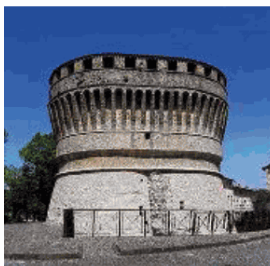
Il torrione di Cagli

Dall'8 al 14 aprile è il Comune di Cagli il nuovo protagonista di «50x50: Capitali al quadrato», il progetto simbolo di Pesaro 2024 che vede i 50 Comuni della Provincia di Pesaro e Urbino, a turno, capitale per una settimana. Il programma s'intitola «Dans l'éternité les choses de l'homme» e propone 7 giorni fitti di occasioni tra mostre, trekking, nuove tappe di «Castelli nascosti», presentazioni editoriali e molto altro, grazie anche al coinvolgimento delle scuole del territorio. Lunedì 8 alle 9.30 si parte con un percorso di trekking urbano a cura degli allievi dell'Istituto Celli, mentre alle 12 nel chiostro di San Francesco inaugurazione della mostra fotografica Art in schools - The faces of innocence. Martedì 9 alle