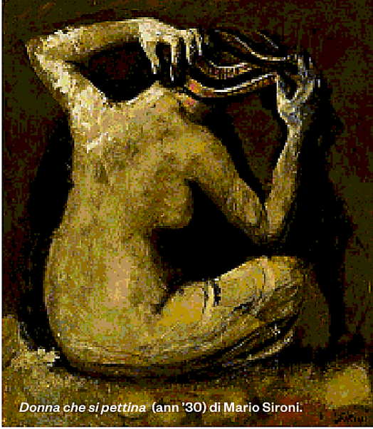
Donna che si pettina (ann '30) di Mario Sironi.