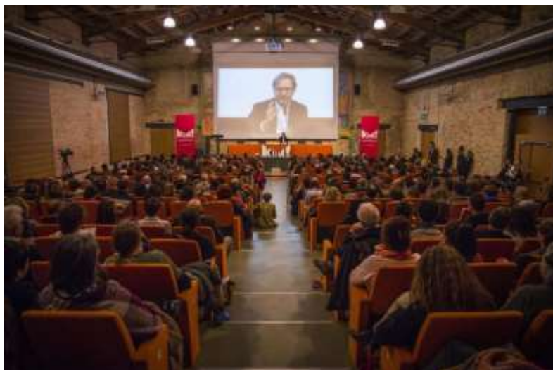
KUM! 2017 conferenza Recalcati

30 appuntamenti tra lectio, dialoghi e conversazioni, organizzati in 10 Cantieri: Cantiere istituzioni; Cantiere antropocene; Cantiere generazioni; Cantiere politica; Cantiere antropologia post trauma; Cantiere economia; Cantiere il vaccino della cultura; Cantiere psicopatologia post covid; Cantiere sanità; Cantiere scuola. Inoltre, 5 eventi speciali tra arte, filosofia, cucina e presentazioni di volumi della collana del festival edita da Melangolo.