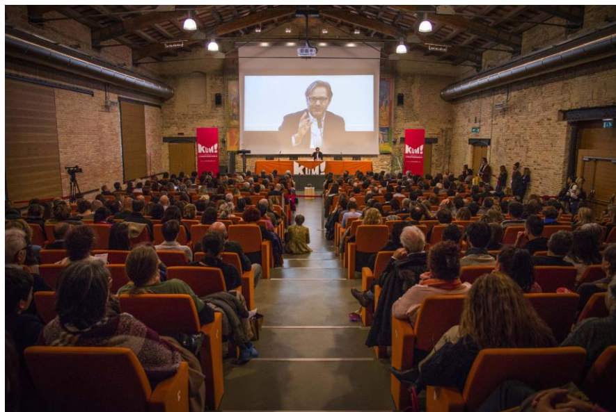
KUM! Festival 2017_conferenza Recalcati

Come ripartire. Cantieri è il titolo dell'edizione 2021 di KUM! : anche quest'anno il festival propone un'edizione speciale, con l'obiettivo di interpretare con fiducia e reinventare creativamente il tema della ripartenza . Dopo aver esplorato, lo scorso anno, il trauma causato dalla pandemia, è ora il momento di indagare come superare le difficoltà del presente. Per farlo, 47 relatori tra filosofi e teologi, psichiatri e psicoanalisti, economisti e politici, sociologi e antropologi, scrittori e artisti, storici dell'arte e scienziati si confrontano in veri e propri Cantieri , intesi come officine aperte, a più voci: contesti di costruzione comune, momenti di condivisione e sperimentazione. Non solo luoghi di diffusione del sapere, quindi, ma impegni collettivi per trovare risposte concrete alle emergenze sociali, politiche, economiche, ambientali e culturali che la pandemia ha sollevato. Non occasioni in cui chiederci in astratto: che cosa dobbiamo sapere? ma invece, in concreto: come possiamo fare?